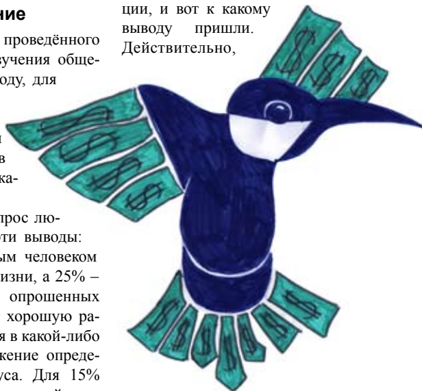
Рисунок Эллины СБИТНЕВОЙ

В поисках формулы мы обсудили определение успеха с членами нашей редакции, и вот к какому выводу пришли. Действительно,