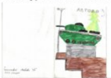
рисунок Чипчиковой Любви, 4"б" класс, лицей №393

Материал из №1 (206) от 27.01.2014 Работы наших ребят читайте в номере