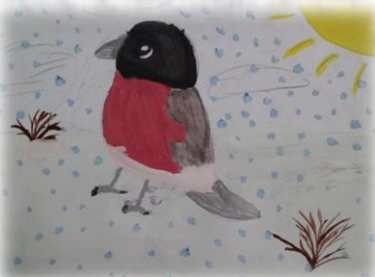
Рисунок Солдаткиной Дарьи, 3в

Проведению акции «Зимующие птицы» не помешала тёплая и короткая зима. Птицы не отказались от нашей помощи. Всегда есть корм в кормушках 1б класса, а ребята из 3в класса ещё и нарисовали своих любимых птиц. Они у них получились, как живые.