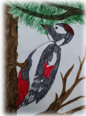
Рисунок Васильевой Марины, 3в