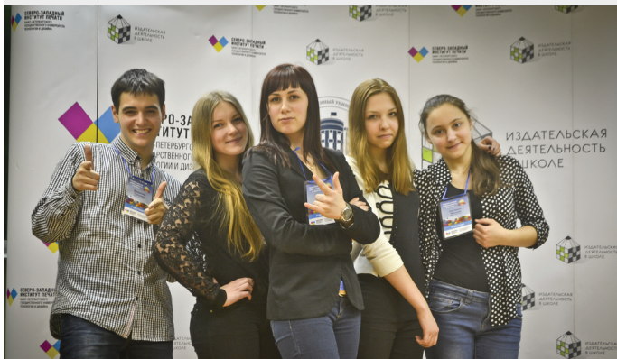
Наша редакция :))

Еще за несколько месяцев до очного этапа мы усердно тренировались, писали разного рода тексты в рамках конкурса «Азбука грамотности». Наши фотографии неустанно фотографировали все на свете, раскрывающие смысл заданной темы. Некоторые участники команды преодолевали себя, нашли новые таланты внутри своего сложного характера. Это помогло нам выйти на новый уровень.